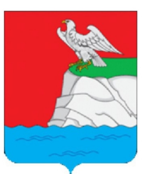
СХЕМА ТЕРРИТОРИАЛЬНОГО ПЛАНИРОВАНИЯ ВЕРХНЕУСЛОНСКОГО МУНИЦИПАЛЬНОГО РАЙОНА Карта планируемого размещения объектов местного значения