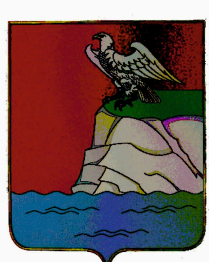
СХЕМА ТЕРРИТОРИАЛЬНОГО ПЛАНИРОВАНИЯ ВЕРХНЕУСЛОНСКОГО МУНИЦИПАЛЬНОГО РАЙОНА

Карта инженерно геологической оценки территории