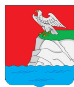
СХЕМА ТЕРРИТОРИАЛЬНОГО ПЛАНИРОВАНИЯ ВЕРХНЕУСЛОНСКОГО МУНИЦИПАЛЬНОГО РАЙОНА Карта планируемого развития промышленного производства