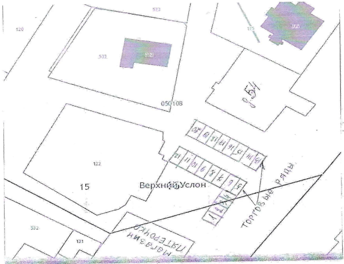
СХЕМА РАЗМЕЩЕНИЯ ТОРГОВЫХ МЕСТ НА ЯРМАРКЕ