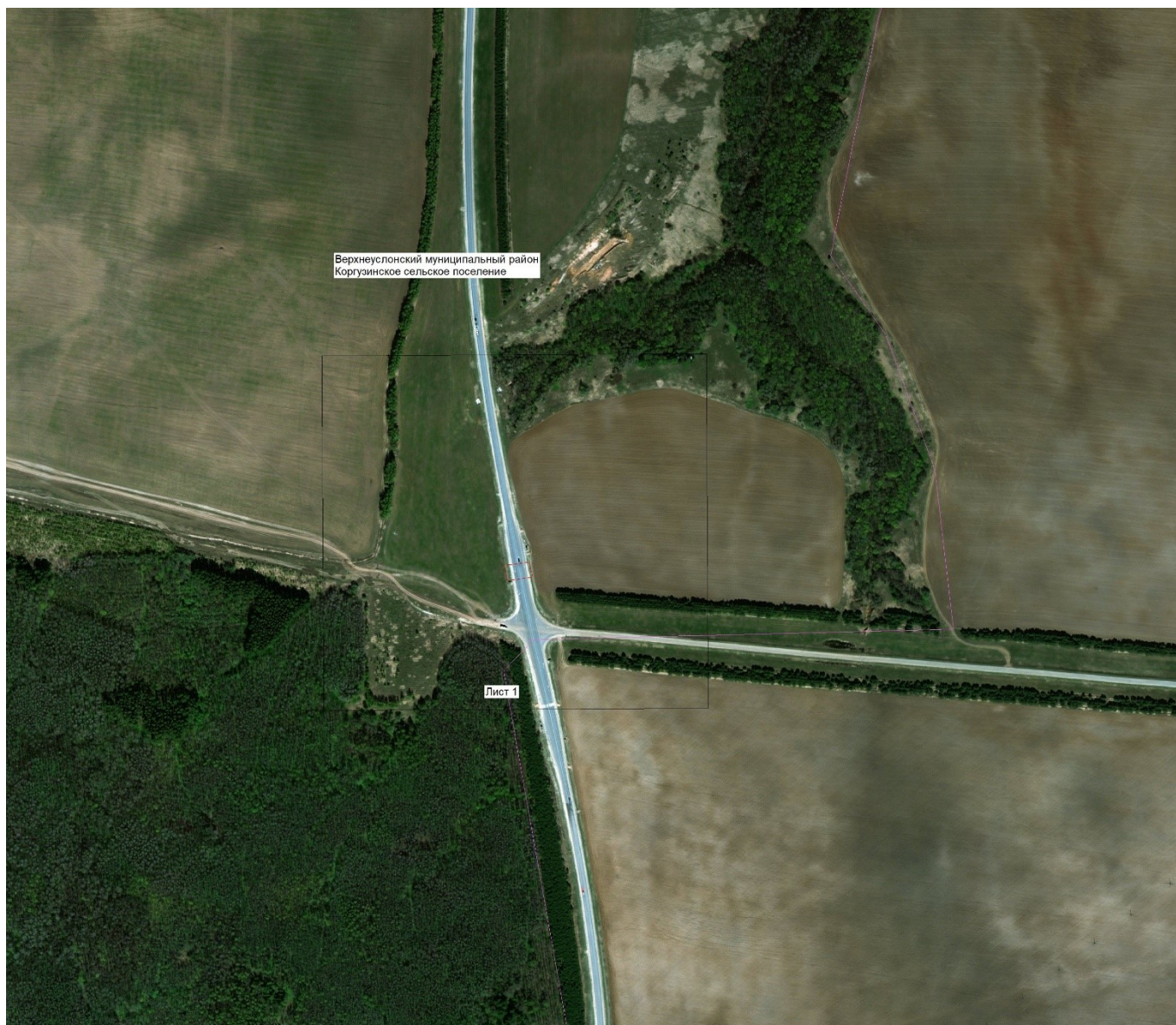
Схема расположения границ публичного сервитута в целях размещения объекта электросетевого хозяйства местного значения «ВЛ 10 кВ ф.6 ПС Майданы, ВЛ 10 кВ ф.12 ПС Макулово» Обзорная схема границ объекта